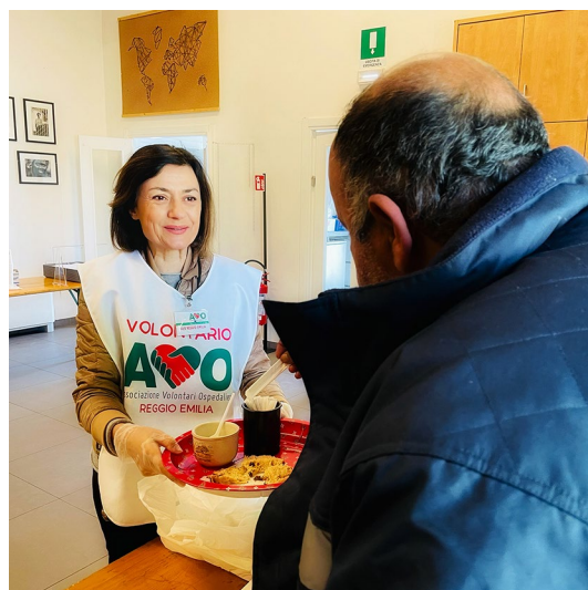
una volontaria di AVO Reggio Emilia in servizio presso una Mensa Diffusa Caritas per accogliere gli ospiti e generare momenti di benessere attraverso la relazione