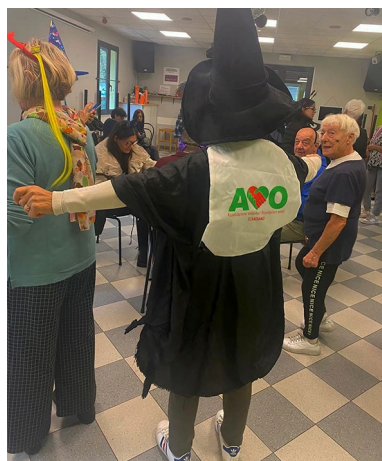
i volontari di AVO Scandiano durante la festa di Halloween al circolo Bisamar nell'ambito del progetto Ciber Café