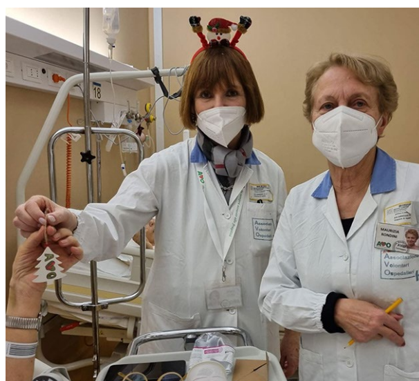
volontarie di AVO Coreggio in servizio all'Ospedale San Sebastiano durante la distribuzione degli auguri natalizi ai degenti: un segno tangibile della vicinanza a chi vive momenti di fragilità