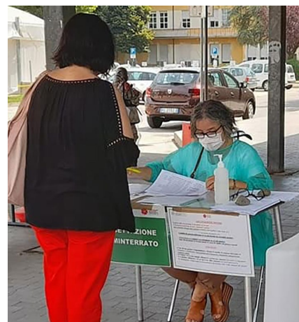
una volontaria di AVO Carpi in servizio presso il polo vaccinale