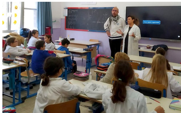
volontari AVO Pesaro nel progetto "conoscere l'AVO", dedicato agli alunni delle Scuole Primarie e finalizzato alla promozione dei valori della solidarietà e dell'empatia