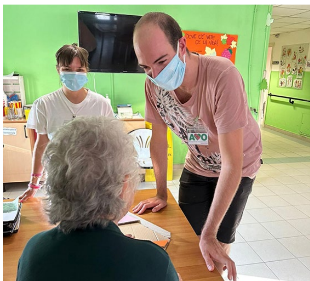
un volontario di AVO Mirandola in servizio alla CRA Villa Rosati di Cavezzo nel progetto "memory": un gioco di memoria per allenare la mente, svolto in collaborazione con le animatrici della struttura