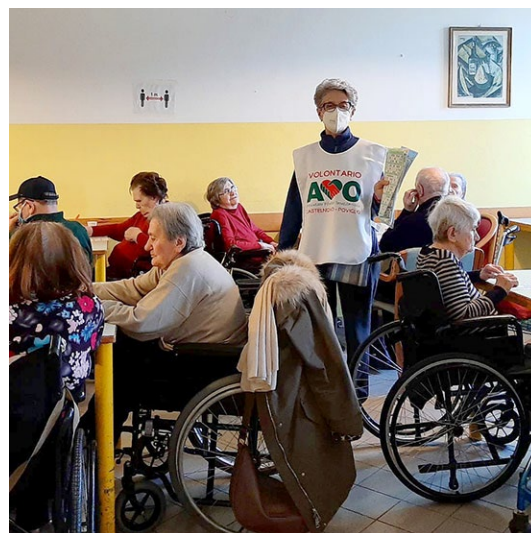
una volontaria di AVO Castelnovo - Poviglio durante il servizio presso la Casa Residenza Anziani