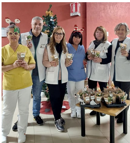
i volontari AVO Cesena durante il servizio all'Hospice di Savignano condividono con il personale ed i degenti un augurio natalizio

Nascono dunque nuovi progetti con le AUSL, collaborazioni con altre Istituzioni, pubbliche e private, con Enti del Terzo Settore: punti informativi e di accoglienza presso le strutture ospedaliere e socio-sanitarie, hub vaccinali , centri diurni per disabili adulti , cyber caffè al sostegno di persone con fragilità psichica , affiancamenti mirati degli ospiti alle Mense Caritas , distribuzione farmaci e generi alimentari , ascolto telefonico ... nuovi modi per essere diversamente ma profondamente volontari AVO.