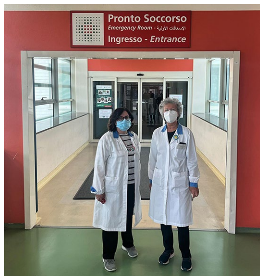
volontarie AVO Modena in servizio presso i Pronto Soccorso del Policlinico e di Baggiovara dell'Azienda Ospedaliero - Universitaria di Modena nell'ambito del progetto "Spezza l'attesa"